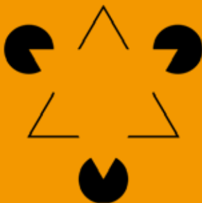
Il triangolo di Kanizsa

Ai partecipanti sarà data in omaggio il libro: In viaggio nella terra di Piero della Francesca